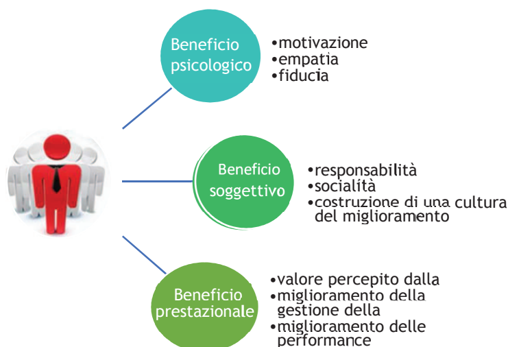
Fig. 9 Benefici percepiti dall'allievo in relazione al feedback di colloquio. Elaborazione personale.

Sulla base di tali considerazioni, la figura 9 mette in rilievo i benefici che potrebbe percepire il corsista; questi riguardano la sua sfera psicologica e il miglioramento dei risultati da conseguire.